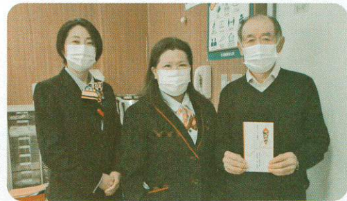
会津ヤクルト販売(株)様

その他、草花でゆうゆう館に彩りを添えていただいたり、農作物はゆうゆう館利用者にプレゼントするなど喜んでいただきました。