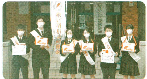
川口高校生赤い羽根共同募金街頭募金ボランティア