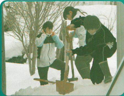
【金山中学校の皆様】

今年も支援に来てくださいました。除雪後、家の中が明るくなったと大変喜んでいただきました。