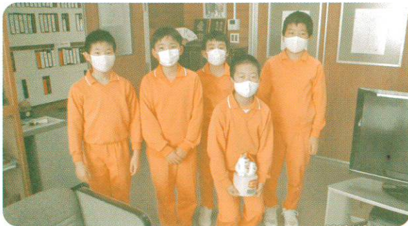
金山小学校赤い羽根共同募金