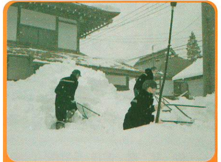
【東北電力グループの皆様】