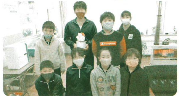
横田小学校赤い羽根共同募金