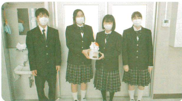
金山中学校赤い羽根共同募金